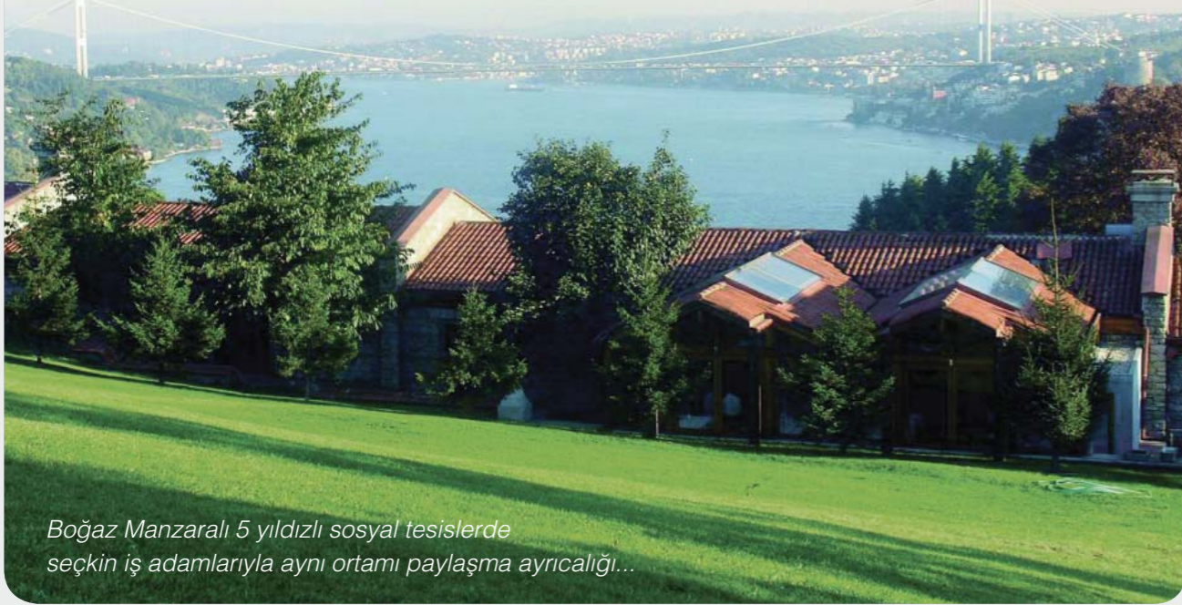
Boğaz Manzaralı 5 yıldızlı sosyal tesislerde seçkin iş adamlarıyla aynı ortamı paylaşma ayrıcalığı...