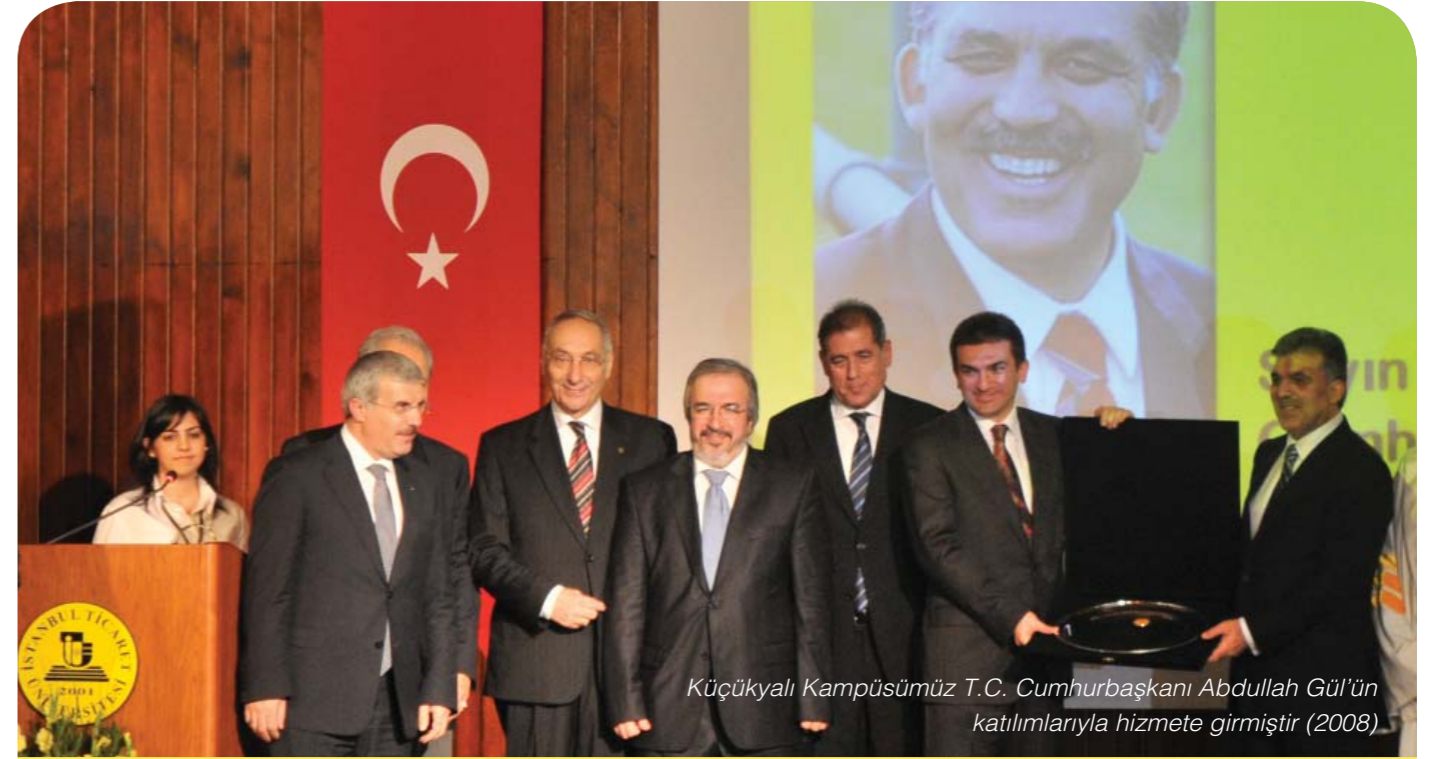
Küçükyalı Kampüsümüz T.C. Cumhurbaşkanı Abdullah Gül'ün katılımıyla hizmete girmiştir (2008)