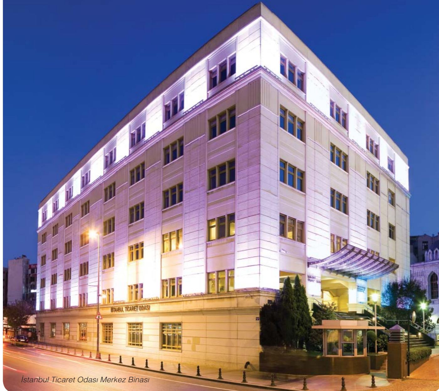
İstanbul Ticaret Odası Merkez Binası

İş dünyasının öncü ve lokomotif kuruluşu, ülkesinin ekonomisine, hukuk düzenine, ticaret ve sanayisine katkı verecek, bilim ve teknolojiadaki gelişmeleri küresel boyutta izleyerek, ürettiği bilgileri tüm insanlığa ve yaşadığı topluma sunacak gençlerimizin yanında. Çünkü güçlü bir Türkiye'nin iyi eğitim görmüş güçlü beyinlere ihtiyacı var.